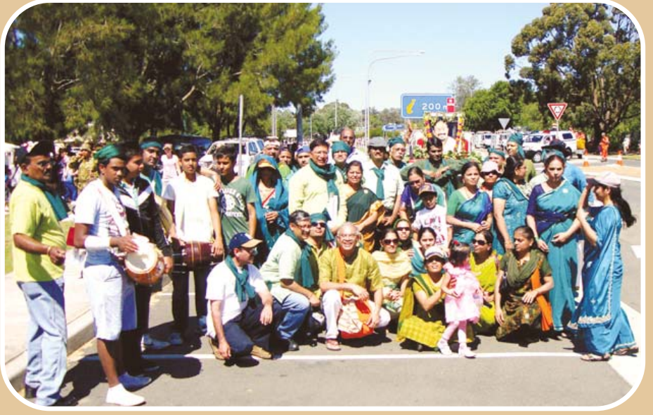
సిడ్డీ (ఆస్ట్రేలియ) నందు నగర సంకీర్తనంలో భక్తులు