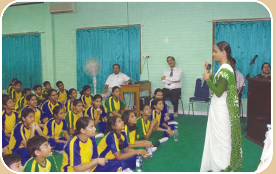
జకార్త (ఇండోనేషియ) నందు విద్యార్థులతో సత్సంఘం