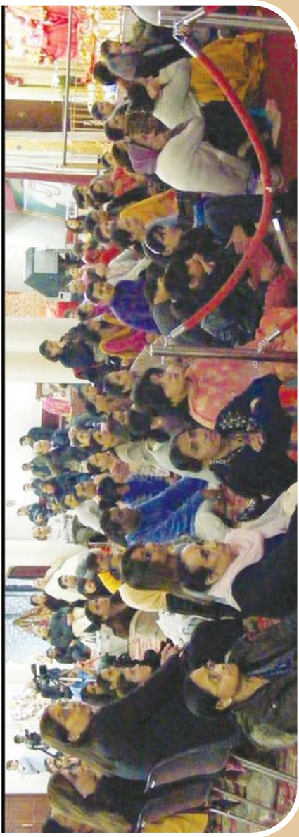
బల్లింగ్ హ్యామ్ (ఇంగ్లాండ్) నందు శ్రీమద్వారకతం